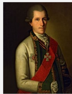
Адмирал С.К. Трейг

В 1774 году был заключен Кючук-Кайнарджийский мир - Крым объявлялся независимым государством, к России отходили крепости Керчь и Еникале в Крыму. Россия получила выход в Черное море, получала право свободного мореплавания по Черному и Азовскому морям. Турция открывала для русских торговых кораблей проливы Босфора и Дарданеллы.