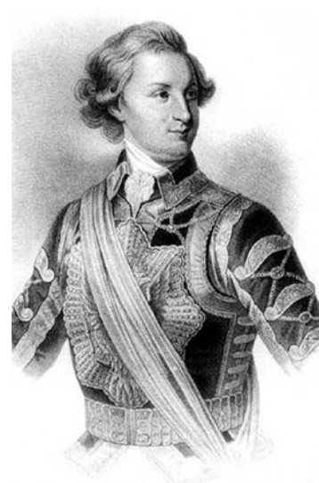
Князь Григорий Александрович Потемкин-Таврический, шеф Кавалергардского корпуса.

Крымские татары были недовольны условиями Кючук-Кайнарджийского договора, в Крыму начались мятежи. В 1777 году на ханском престоле при поддержке русских войск утвердился Шагин-Гирей, который принял сторону России. В Крыму неоднократно вспыхивали бунты; чтобы справиться с ними, хан был вынужден прибегать к помощи русской армии. В 1783 году Шагин-Гирей отрекся от престола, и Крым был присоединен к Российской империи под древним именем Таврида Манифестом Екатерины II от 8 апреля того же года.