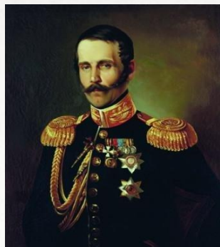
Фёдор Лукич Строганов (1497-...)-правнук Спиридона, обосновался в Соли-Вычегодской