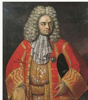
Григорий Дмитриевич Строганов (1656-1715)-крупный русский промышленник, землевладелец, финансист и политический деятель.