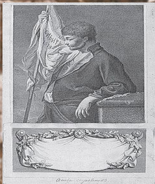
Строганов Аникей Фёдорович (1488-1569)-создатель солеваренной промышленности в Перми Великой, колонизатор прикамских земель