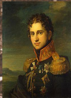
Павел Александрович Строганов (1772-1818)-генерал-лейтенант. Участник Великой французской революции и якобинского клуба «Гражданин Очер». Член Негласного комитета. Герой войн с Наполеоном.