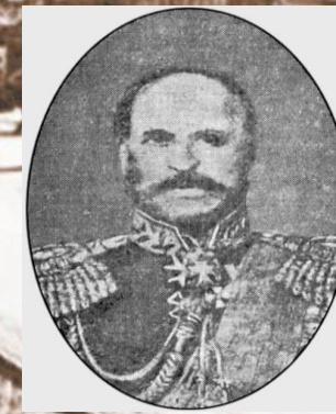
Александр Григорьевич Строганов (1795-1891)-товарищ министра внутренних дел, затем управляющий Министерством внутренних дел, Член Государственного комитета, генерал артиллерии.