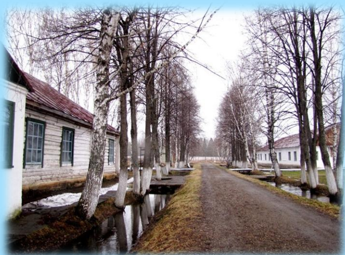
В «Перми-36» можно увидеть аллею, которая была посажена заключенными в 1948 году.