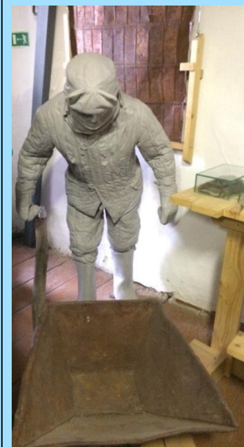
С 2005 г. ежегодно на территории музея политических репрессий «Пермь-36» проходил международный форум «Пилорама», в рамках которого проводились встречи с известными людьми, кинопоказы, выставки.