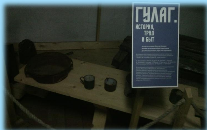
Идея создания музея ГУЛАГа возникла в 1992 году. Четыре года ушло на подготовку музея к открытию. В 1996 году музей истории политических репрессий «Пермь-36» принял первых посетителей.