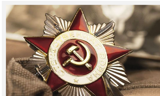
Знамя Великой Отечественной войны

Приходят к дедушке друзья Отпраздновать Победу. Все меньше их, Но верю я: они опять придут.