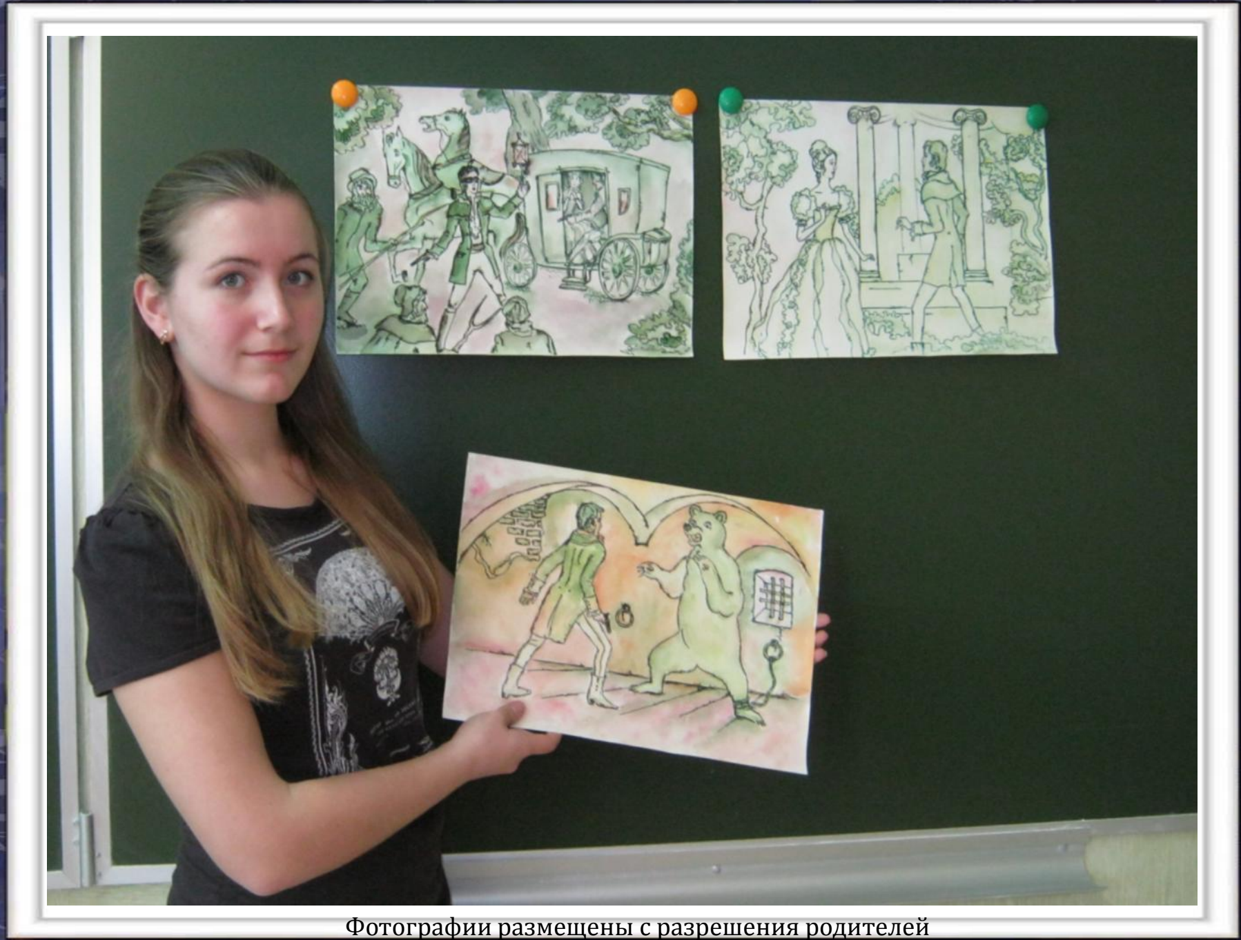
Фотографии размещены с разрешения родителей