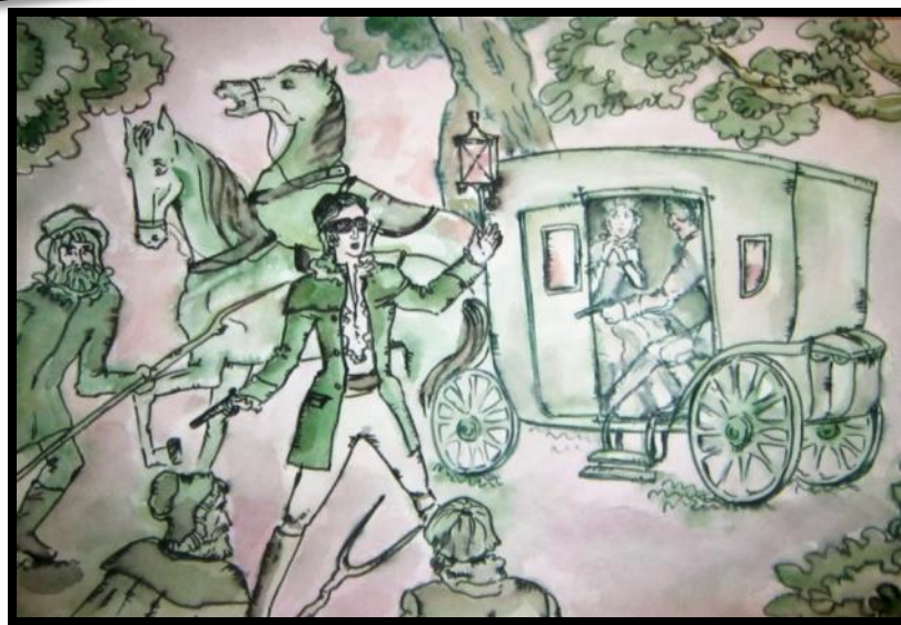
Виктория Шилова. Иллюстрации к роману А.С.Пушкина "Дубровский"