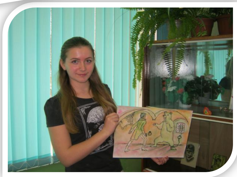
Фотографии размещены с разрешения родителей