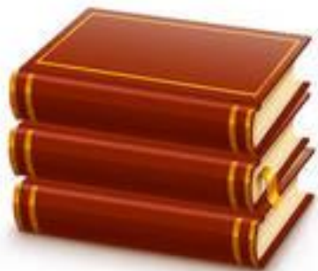
Иллюстрация – основа книжного искусства. Художник-иллюстратор по праву считается соавтором произведения. Он трактует литературное произведение, расширяя и дополняя текст зрительными образцами, помогая читателю понять сокровенные мысли автора, глубже почувствовать эпоху и предметный мир, сопутствующий литературному произведению.