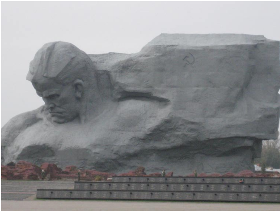
Памятник погибшим в ВОВ в Бресте