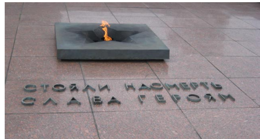
Вечный огонь в Бресте