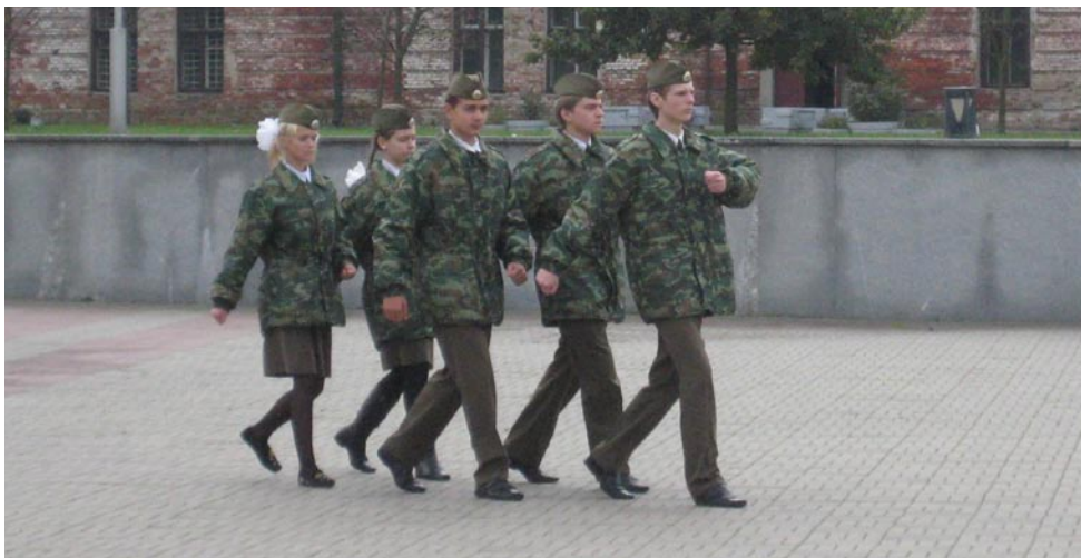
Смена караула у вечного огня в Бресте

Такого не забудешь дня. Здесь память входит в силу: В Берлине девочка меня Дать хлеба попросила. Ей кажутся темней тенью Земля, руины, небо. Забыли взрослые о ней И не дают ей хлеба. Ей непонятно, почему Ты, небо, так устало. Что даже богу самому Не до нее вдруг стало. Страшнее самых страшных слов Тот взгляд, упрек тот жесткий. Старушка девяти годов Стоит на перекрестке. Раскрою вещмешок, отдам Свой хлеб. Но где взять средство, Чтоб годы возвратить годам И вновь дать детству детство?..